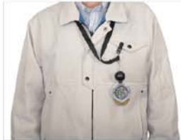
作業服の胸ポケット