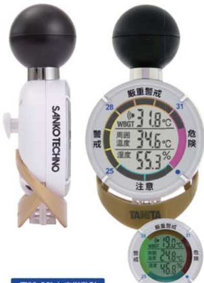
黒球式熱中症指数計 熱中アラーム

熱中症にかかわる要因の日射や輻射熱を測定できます。そのため直射日光が当たる場所でも、WBGTをより正確にお知らせすることが可能です。