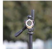
三脚に取り付けて