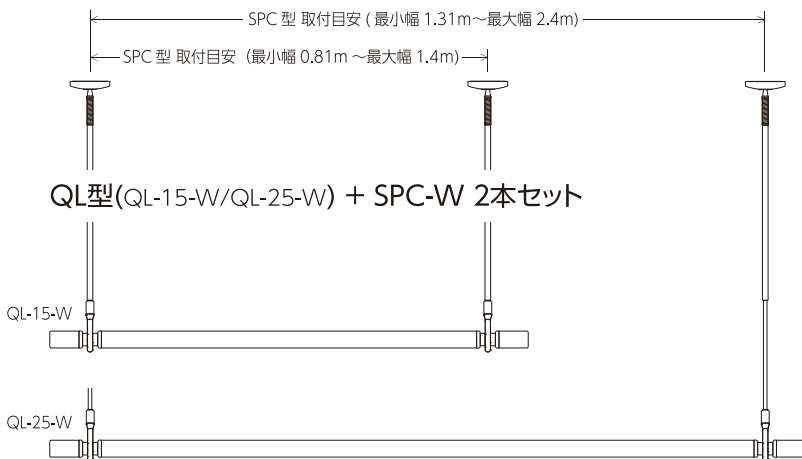
QL型(QL-15-W/QL-25-W) + SPC-W 2本セット